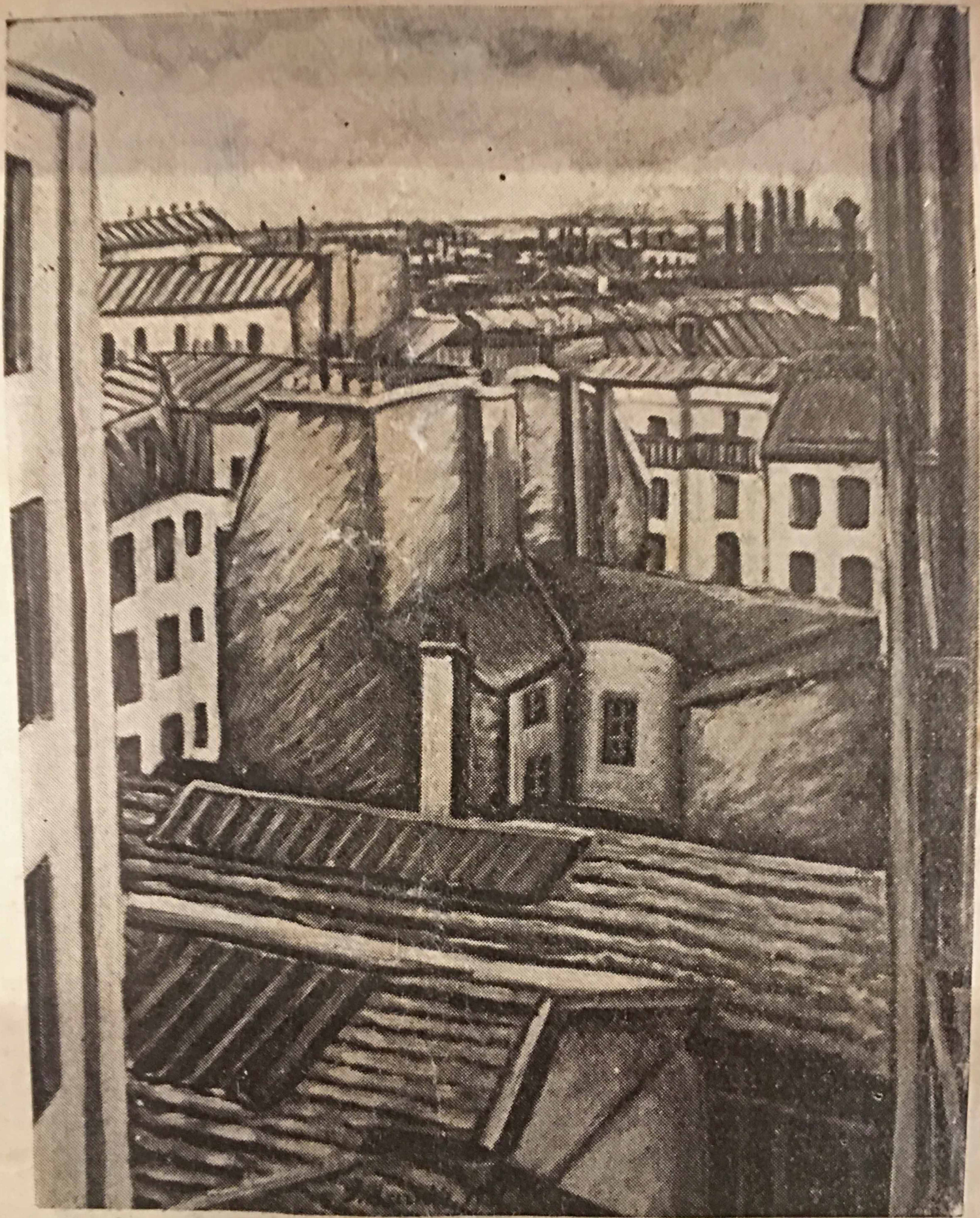
PAYSAGE PAR JACOB MACZNIK