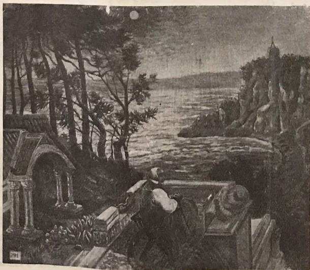
« SOLEIL LEVANT », PEINTURE D'ANDRÉ MICAYET

Jacob Macznik montre dans sa peinture, en même